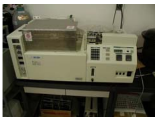
名称 ： 全炭素・全窒素分析装置 型式 ：SUMIGRAPH NC-22F 場所 ：化学分析室