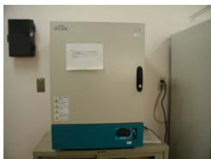
名称 ： 恒温乾燥機 型式 ：AS ONE DOV-450A 他 1 台 場所 ：化学分析室