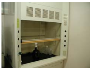
名称 ： ドラフト・チェンバー 型式 ：AS ONE ASF-1200 場所 ：化学分析室