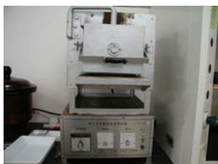
名称 ： マッフル炉 型式 ：田中化学機械製造所 TMF-2 (Max 1200°C) 場所 ：化学分析室