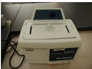
名称 ： 超音波洗浄器 型式 ：Branson 2510 場所 ：化学分析室