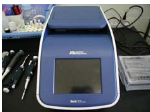
名称 ： 蛍光光度計 型式 ：Turner Designs Trilogy Laboratory Fluorometer 場所 ：化学分析室