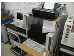
名称 ： 有機炭素分析装置 型式 ：Shimadzu TOC-VCSH 場所 ：化学分析室